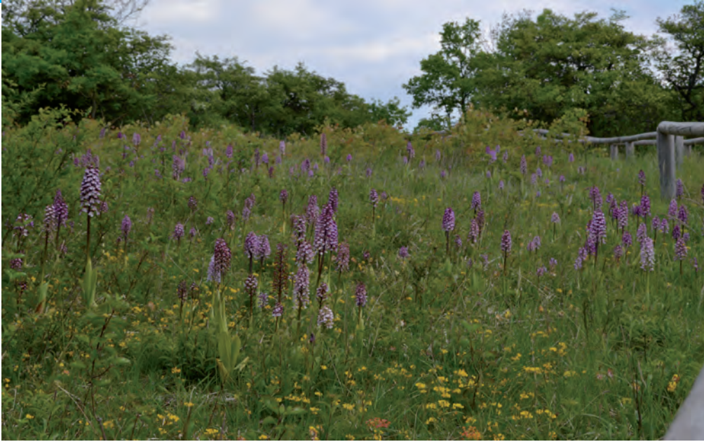
Eindrücke aufgesammelt von N. Baumbach, V. Metzling