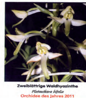
Zweiblättrige Waldhyazinthe Platanthera bifolia Orchidee des Jahres 2011